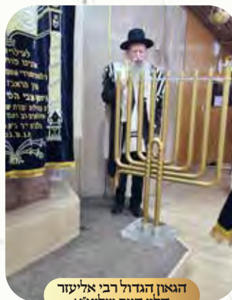
הגאון הגדול רבי אליעזר הלוי דיער שליט"א