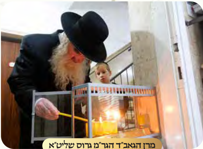
מרנן הגאב"ד הגר"מ גרוס שליט"א