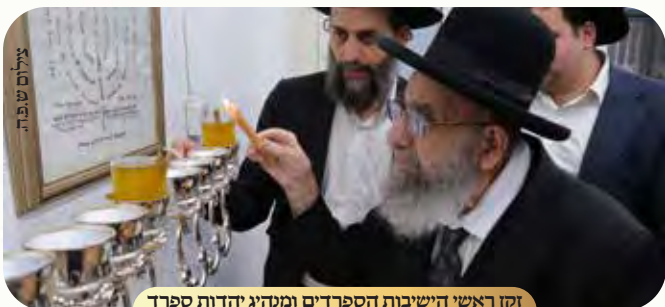
זקן ראשי הישיבות הספרדים ומנהיג יהדות ספרד הגאון האדיר רבי משה צדקה שליט"א