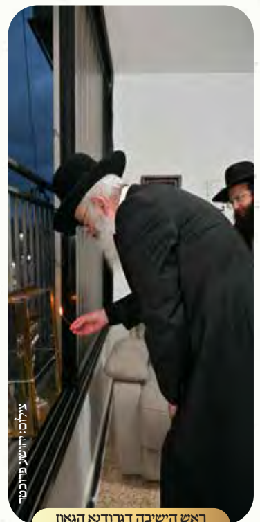
ראש הישיבה דגורא הגאון הגדול רבי משה שמידע שליט"א