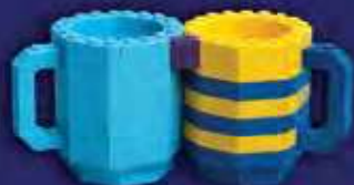
סדנת קשר בין אישי