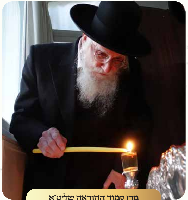
מרנן עמוד ההוראה שליט"א