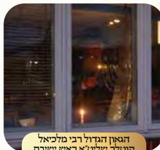
הגאון הגדול רבי מלכיאל קוטלר שליט"א ראש ישיבת בית מדרש גבוה לייקוד