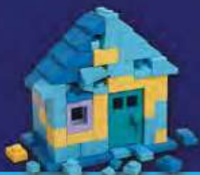
סדנת חינוך ילדים

לכל אחד מאיתנו כדאי לקבל ייעוץ מקצועי שישפר את איכות החיים ויעצים את הטוב והשפע. מודעות, חינוך ילדים וקשר בין אישי, בדרך התורה ובהמלצת רבנים. הנקודה היא, שבכל התמודדות בשלבי החיים, הפתרון טמון בר. צריך רק את הפנס מבחוץ שיאיר על הנקודות הנכונות.