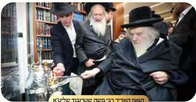
הגאון האדיר רבי משה שטרנבוך שליט"א