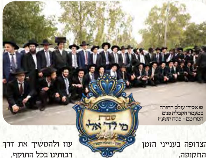
63 אסירי עולם התורה במעמד הקבלת פנים המרום - פסח תשע"ז

רבינו הגדול זצוק"ל עורר מידי שנה בשנה על גודל השעה ועל ההכרח להנחיל את היסודות האיתנים עליהם מושתת ומהם יונק עולם התורה והישיבות, זאת באמצעות הנחלת דרכי ההשקפה הצרופה בדרכם של ראשונים, יחד עם דרכי ההנהגה המיוחדת של בני התורה, ודעת התורה