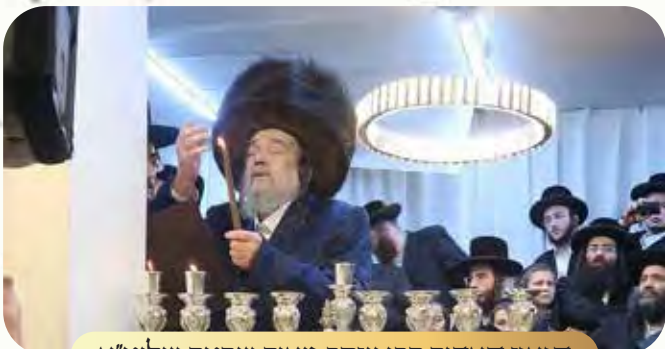
הגאון האדיר רבי יעקב מאיר שכטר שליט"א